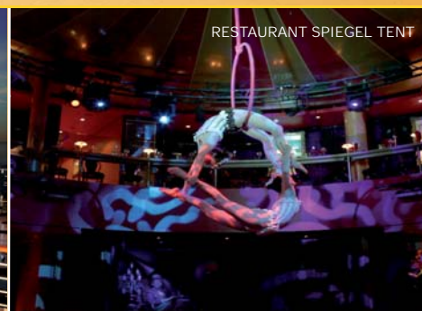
RESTAURANT SPIEGEL TENT