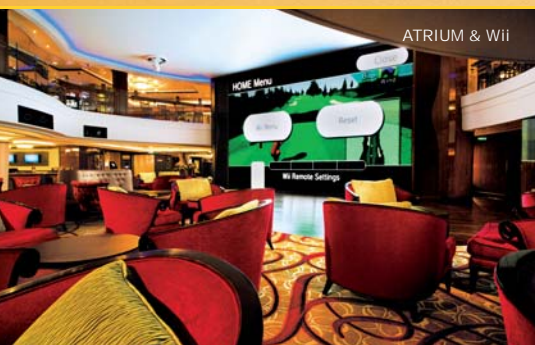
ATRIUM & Wii