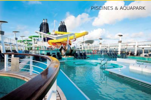
PISCINES & AQUAPARK