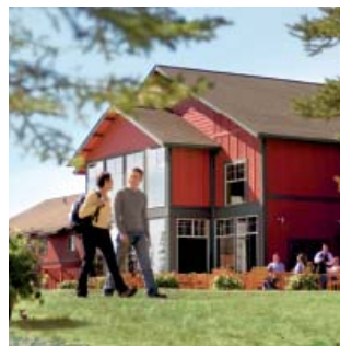
Copper River Princess Wilderness Lodge®