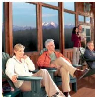
Mt. McKinley Princess Wilderness Lodge®