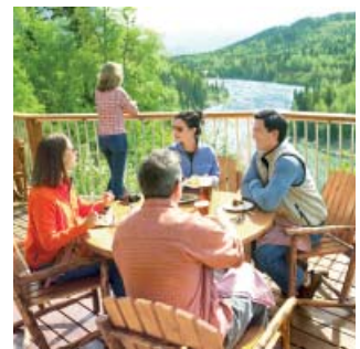
Kenai Princess Wilderness Lodge®