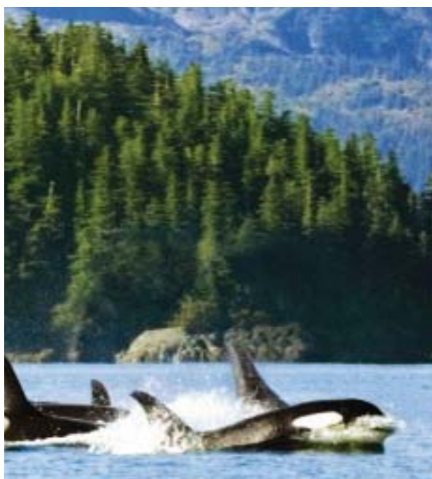
Orques nageant dans le Détroit Prince William, Alaska

* Princess se réserve le droit de rétablir une surcharge carburant jusqu'à €9 par personne et par nuit pour tous les passagers, si l'indice pétrolier IMEX débase les $70 le baril, même si la réservation a été entièrement soldée. Les Taxes et Frais portuaires d'un montant allant jusqu'à €95 par personne sont à ajouter et sujet à modification sans préavis. Tarifs basés sur les dates en gras. Certaines restrictions s'appliquent. Voir page 7 pour plus de détails.