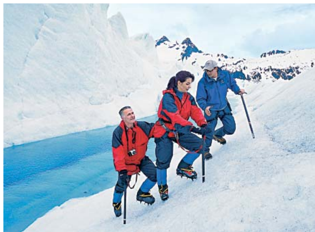
Randonnée sur un Glacier en Alaska

Retrouvez plus d'informations sur les excursions sur notre site : princess.com/excursions