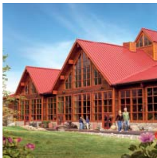
Denali Princess Wilderness Lodge®

Note: La partie Autocar peut être substituée par le train sur certains départs.