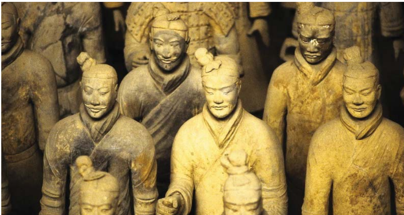
Armée de Terre Cuite — Xian, China