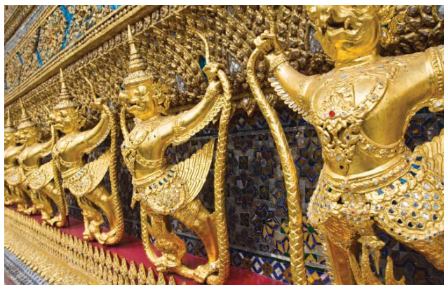
Grand Palais — Bangkok, Thaïlande

Retrouvez plus d'informations sur les excursions sur notre site : princess.com/excursions