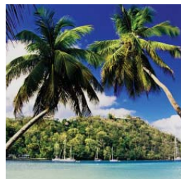
Caraïbes, Mexique & Côte Pacifique