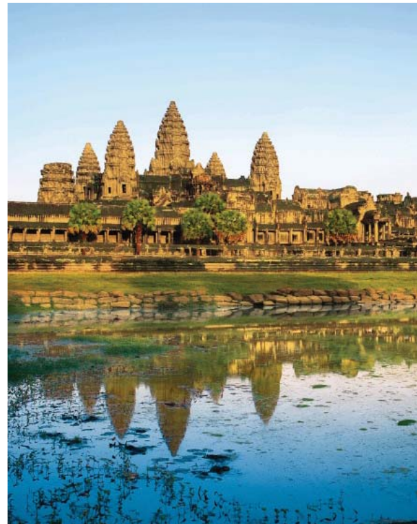
Angkor Wat, Cambodge

*Princess se réserve le droit de rétablir une surcharge carburant jusqu'à €9 par personne et par nuit pour tous les passagers, si l'indice pétrolier IMEX débasse les $70 le baril, même si la réservation a été entièrement soldée. Les Taxes et Frais portuaires d'un montant allant jusqu'à €145 par personne sont à ajouter et sujet à modification sans préavis. Tarifs basés sur les dates en gras. Certaines restrictions s'appliquent. Voir page 6 pour plus de détails.