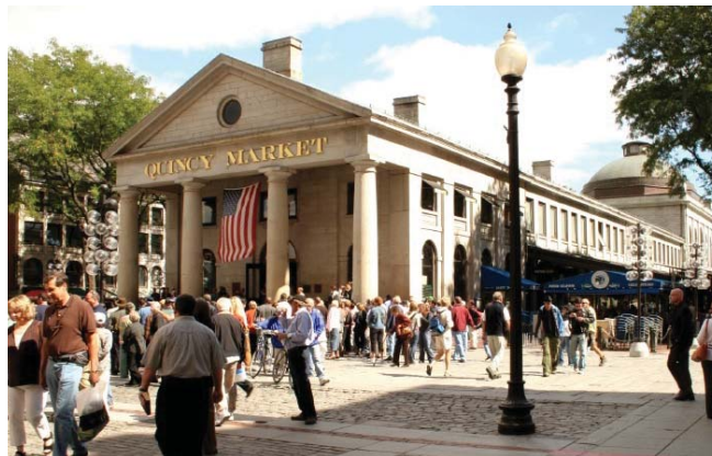
Marché Quincy — Boston, Massachusetts

Retrouvez plus d'informations sur nos excursions sur notre site: princess.com/excursions