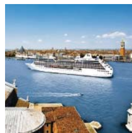
Tours du Monde