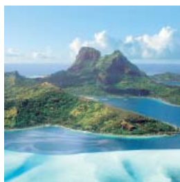
Hawaii, Tahiti & Pacifique Sud