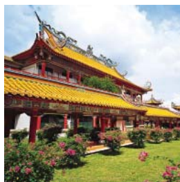
Asie, Inde & Afrique