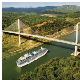
Canal de Panama