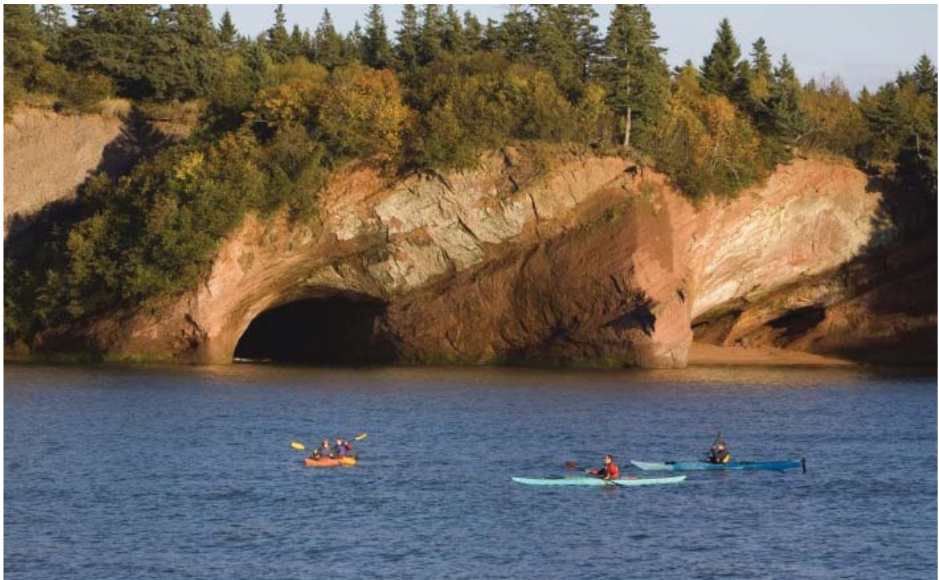
Grottes Maritimes — Nouveau Brunswick, Canada

*Princess se réserve le droit de rétablir une surcharge carburant jusqu'à €9 par personne et par nuit pour tous les passagers, si l'indice pétrolier IMEX débasse les $70 le baril, même si la réservation a été entièrement soldée. Les Taxes et Frais portuaires d'un montant allant jusqu'à € 155 par personne sont à ajouter et sujet à modification sans préavis. Tarifs basés sur les dates en gras. Certaines restrictions s'appliquent. Voir page 3 pour plus de détails.