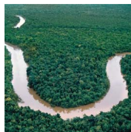
Amérique du Sud & Amazone