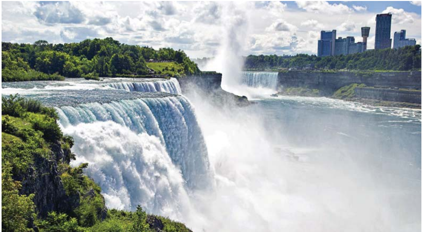
Chutes du Niagara — Ontario, Canada