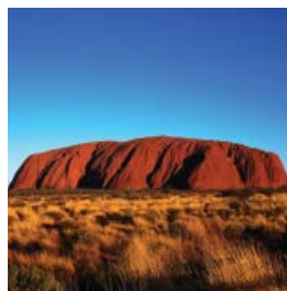
Australie & Nouvelle-Zélande