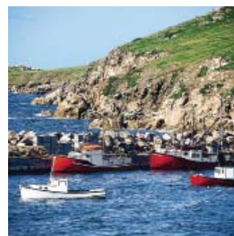
Canada & Nouvelle Angleterre