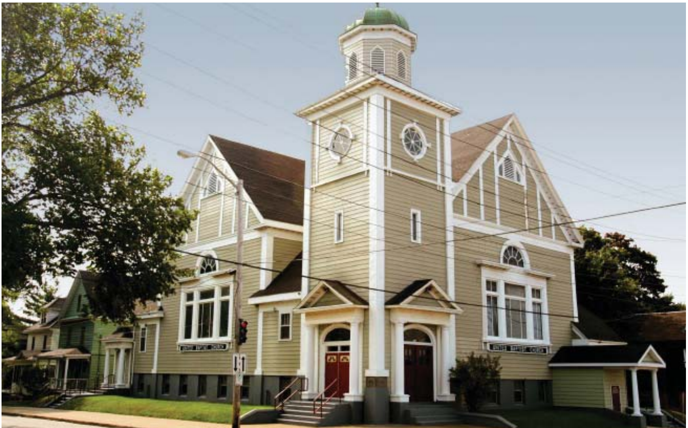
Sydney, Nouvelle-Ecosse, Canada

*Princess se réserve le droit de rétablir une surcharge carburant jusqu'à €9 par personne et par nuit pour tous les passagers, si l'indice pétrolier IMEX débasse les $70 le baril, même si la réservation a été entièrement soldée. Les Taxes et Frais portuaires d'un montant allant jusqu'à €180 par personne sont à ajouter et sujet à modification sans préavis. Tarifs basés sur les dates en gras. Certaines restrictions s'appliquent. Voir page 3 pour plus de détails.