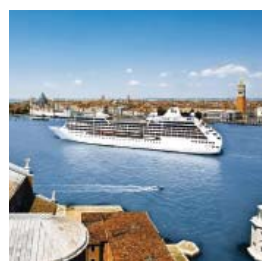
Tours du Monde