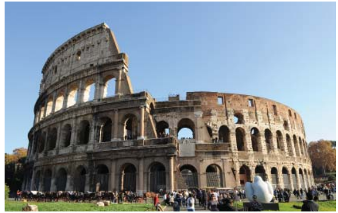
Le Colisée — Rome, Italie